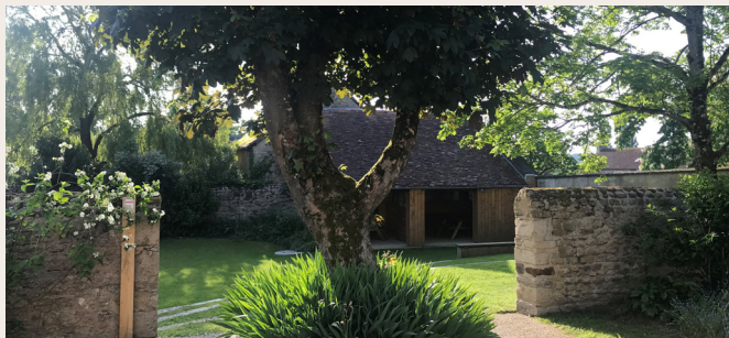
La maison des randonneurs

Le Manoir de Couesme : Propriété de la famille de Couesme, alliée à la couronne de France, le manoir (XIV-XVIème) est l'un des plus vieux bâtiments du Haut-Maine.